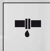
Detekcia úniku chladiva