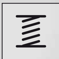
3D DC Invertor